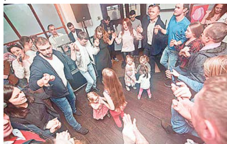
La sărbătoarea Mărțișorului din Londra moldovenii au încins hore și sârbe.