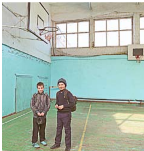
Elevii din Crihana Veche nu mai practică educația fizică în sala de sport, deoarece acoperișul clădirii este fisurat.

jilave. „Dacă pe timp de vară ploua mai multe zile, pe podea creșteau ciuperci. Nu, nu glumesc, acoperișul sălii de sport nu a fost reparat capital de când a fost construită sala, de prin anii 1980”, mai adaugă directoarea liceului.