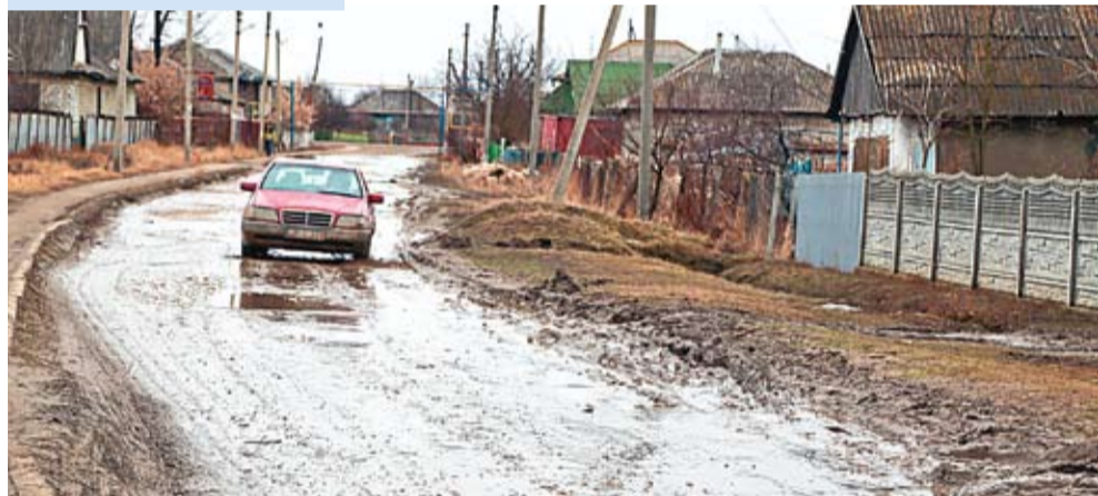
La toamnă, comuna Gura Galbenei va avea în localitate un drum european.