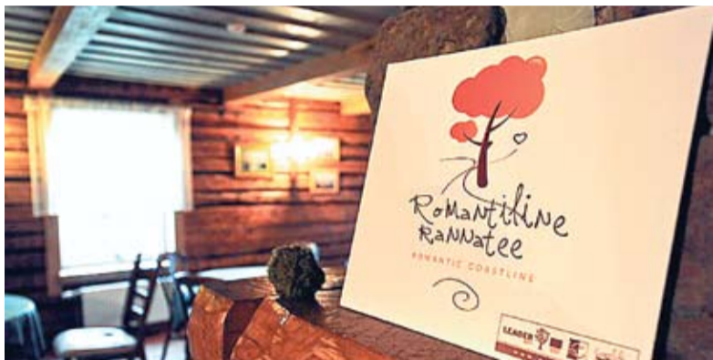
Traseul romantic adună laolaltă valori culturale, istorice și naturale.