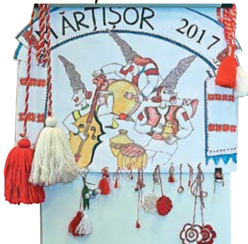
Expoziție de mărțișoare organizată de diaspora moldovenilor și românilor din orașul Vilnius, Lituania.