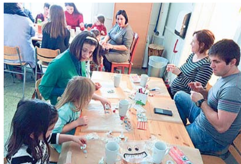
Participanții șezătorii de la Oslo au confecționat mărțișoare și au decorat câni.