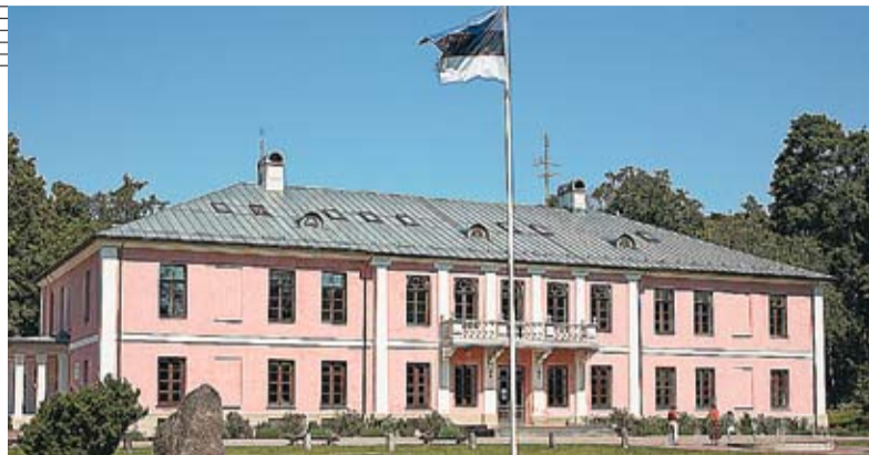
Conacul din Tostamaa a devenit școală.

fermieri, întreprinzători, autorități locale și reprezentanți ai societății civile. Astfel, au apărut Grupurile de Acțiune Locală, care demonstrează că este mai eficient ca o comunitate să-și adune resursele pentru a se dezvolta print-o viziune unică, transpusă într-o Strategie de Dezvoltare Locală. Prin această abordare, GAL pot atrage atenția mai bine la nevoile și prioritățile fiecărei regiuni, deoarece acestea sunt parte a teritoriului în sine. Este o părere pe care o împărtășesc și autorii studiului „Formarea Grupurilor de Acțiune Locală în satele Republicii Moldova - o șansă pentru dezvoltare”.