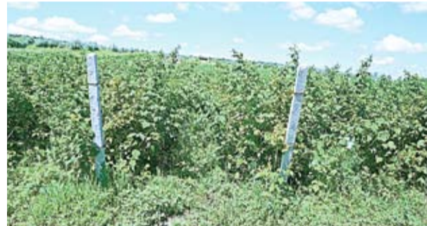
Spalierele și sârma pe care se sprijină tufele de zmeură au fost cumpărate din ajutorul danez

Antreprenorul de la Zaim nu s-a limitat însă doar la cultivarea zmeurei. La marginea zemurișului, pe o suprafață de șase ari, crește puietii de pomi fructiferi - meri, peri, caiși, vișini, cireși, gutui și pruni. Dragostea pentru muncile agricole a moștenit-o de la părinții săi. Și aceștia și-au