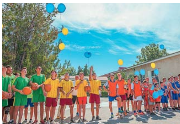
La Varnița, copiii se bucură de o vară specială

În prezent, în localitățile din dreapta și stânga râului Nistru sunt renovate 20 de obiecte de infrastructură socială. De la lansarea Programului, în 2009, UE a acordat peste 7,5 milioane de euro pentru modernizarea infrastructurii sociale din regiune.