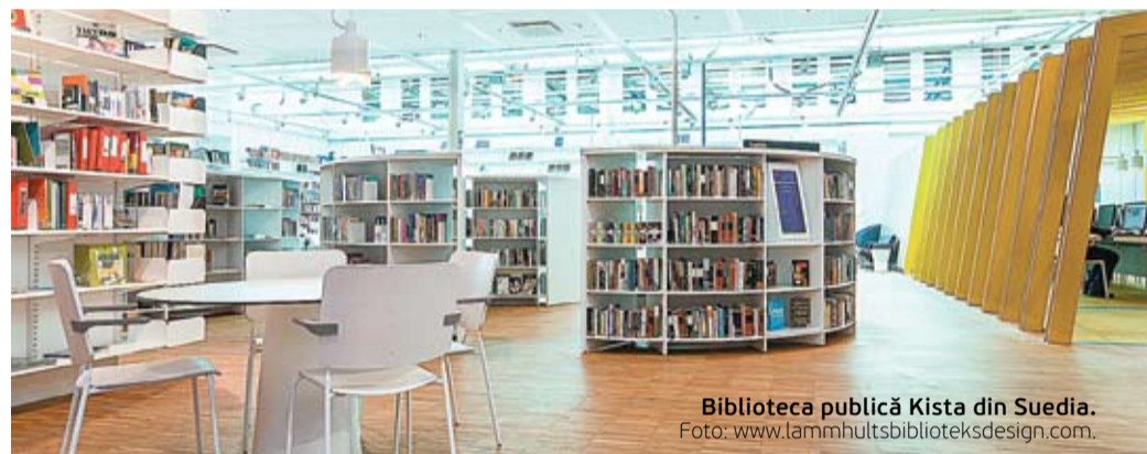
Biblioteca publică Kista din Suedia.

și oferă, pe lângă cărțile obișnuite (care pot fi rezervate online), cărți audio și e-book-uri, reviste, ziare, DVD-uri, articole de vânzare, un scanner și mai multe imprimante, o sală de conferințe care poate fi arendată, abonamente de transport pentru seniori și persoane cu dizabilități și chiar seminare pentru șomeri. Printre activitățile bibliotecii putem menționa grupul de citit sau atelierele IT, în cadrul cărora oamenii de toate vârstele învață cum să navigheze pe internet, utilizând cele trei laptopuri și 11 calculatoare