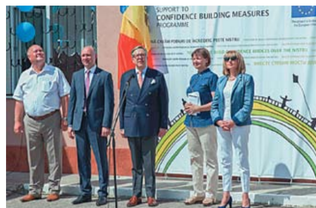
Ambasadorul Pirkka Tapiola și premierul Pavel Filip, la ceremonia de inaugurare a Complexului

Prezent la deschiderea Complexului, ES Pirkka Tapiola, Ambasadorul UE în țara noastră, a ținut să menționeze că inaugurarea terenurilor de sport exact în perioada când se desfășoară Campionatul European de Fotbal este oarecum simbolică și plină de inspirație: „Urmărind turnee sportive sau practicând sportul, noi împărtășim valori de prietenie, respect și înțelegere reciprocă. Sper ca acestea să fie împărtășite și între alte comunități de pe ambele maluri ale râului Nistru, și cu alte ocazii. Sunt mândru de ceea ce am făcut pentru a le asigura acestor copii un viitor mai bun”.