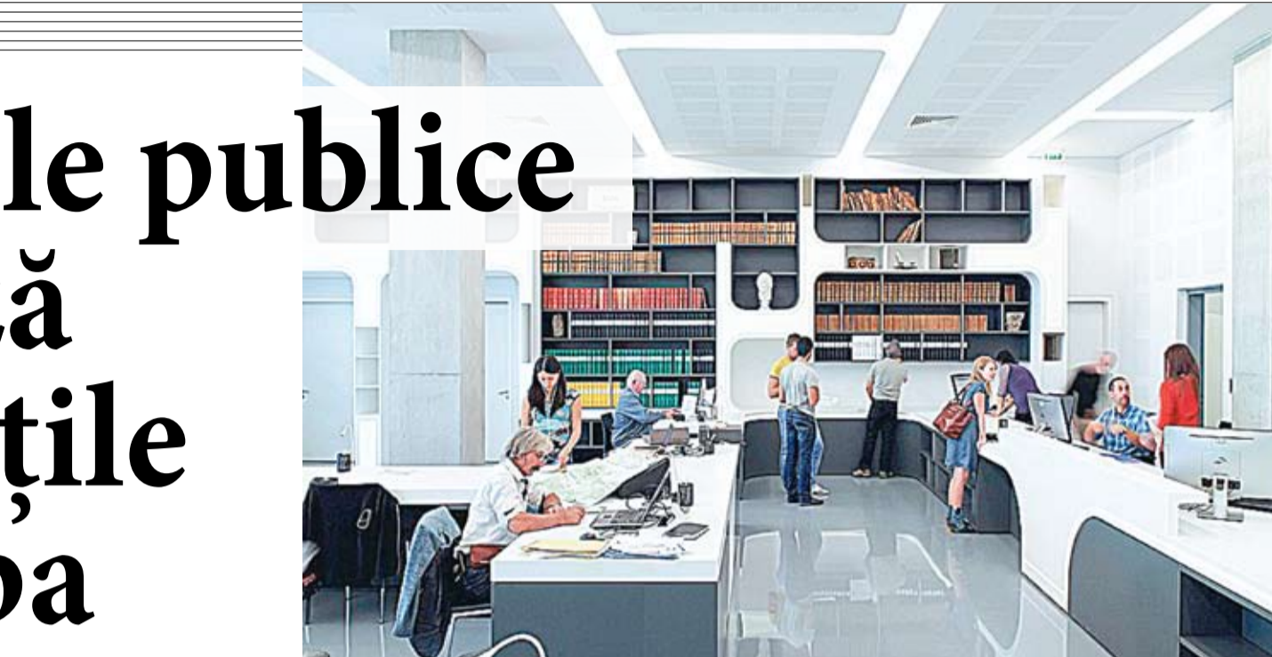
Biblioteca din Mont Mesly Crétel, Franța.

Creată în octombrie 2011, biblioteca este deschisă timp de 26,5 ore pe săptămână