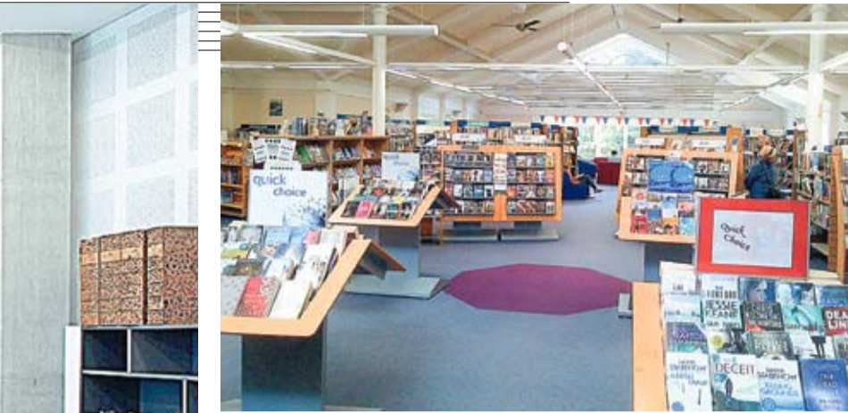
Biblioteca din Farnham, Anglia.