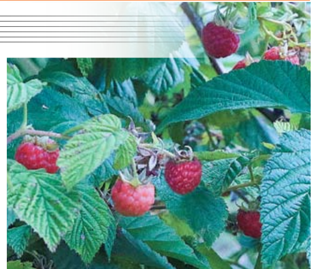
Zmeura este culeasă o dată la trei-patru zile