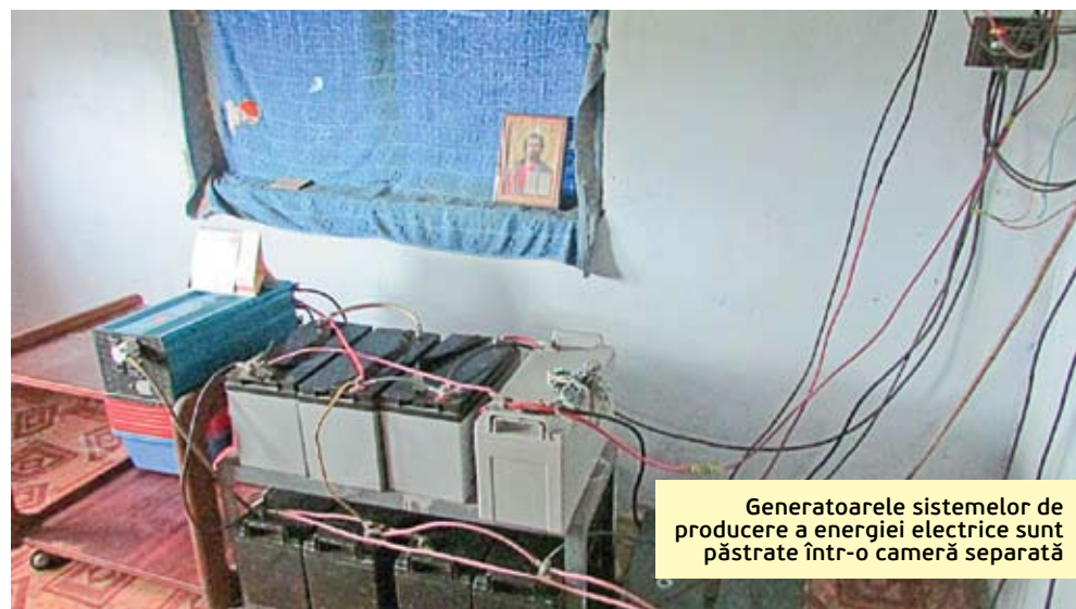
Generatoarele sistemelor de producere a energiei electrice sunt păstrate într-o cameră separată