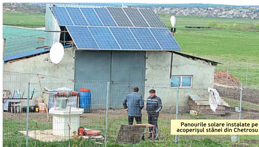
Panourile solare instalate pe acoperișul stânei din Chetrosu