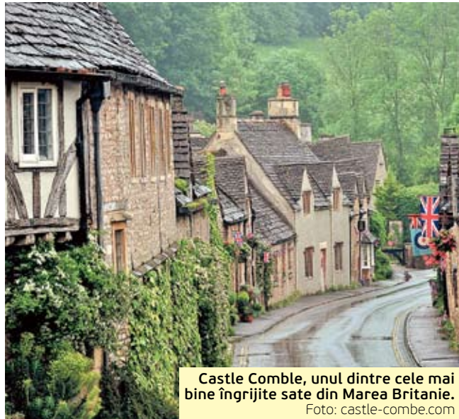
Castle Combe, unul dintre cele mai bine îngrijite sate din Marea Britanie.