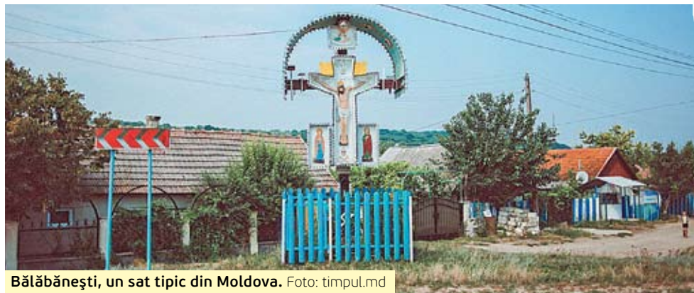
Bălăbănești, un sat tipic din Moldova.

Marea Britanie este țara cu cele mai frumoase și bine păstrate sate din Europa, arată portalul „When on Earth”. Pentru mulți britanici, satul reprezintă un ideal: potrivit unui sondaj recent, circa 80% din englezi visează să trăiască în provincie, în timp ce doar 20% trăiesc în mediul rural. Comunitățile sătești englezești sunt mici și deseori excentrice, dar sunt calde și primitoare, reflectând farmecul local al „caracterului tipic englezesc”. Oficiul poștal sau magazinul reprezintă punctele-cheie de comunicare ale fiecărui sat, în timp ce pub-ul îți oferă șansa de a cunoaște cultura locală. Dar inima multor comunități