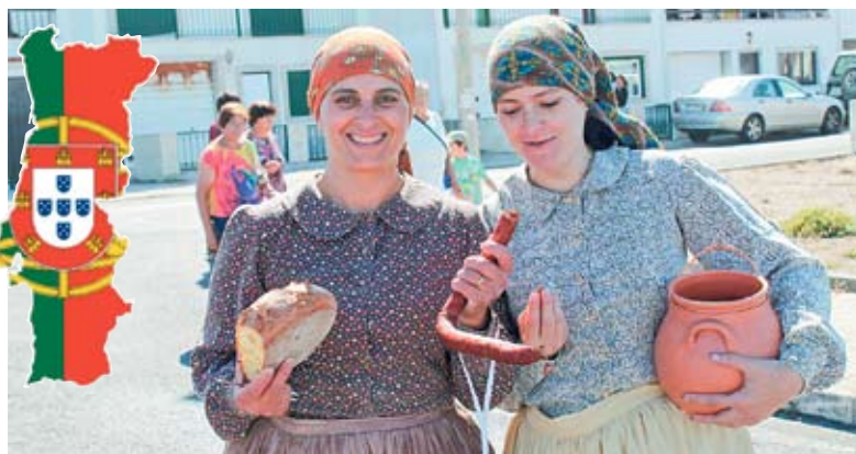
Serbare populară la Santa Cruz. Toată lumea, inclusiv șoferii străini care au norocul să treacă pe acolo în asemenea momente de veselie și degajare totală, este servită cu pâine proaspătă și cârnați de casă, stropiți (cu măsură!) cu aquardente, țuică portugheză.

VIAȚA COMUNITARĂ: portughezii pun mare preț pe viața comunitară. De la brutării comune în centrul satului până la spălătorii cu cișmele de sute de ani unde ghilesc pânza... Nu că nu ar avea condiții s-o facă acasă, dar unde mai găsești asemenea atmosferă propice pentru discuții despre cele veșnice și lumești în egală măsură?