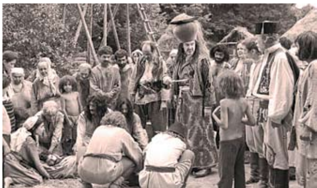
Secvență din filmul „Aferim!”.

buget de 1 mln. 400 mii euro), dorindu-se road movie clasic, gen western (mai curând, eastern). Povestea, imaginată de Radu Jude și co-scenaristul său de căpătâi, ieșeanul Florin Lăzărescu (născut în 1974) se petrece în Valahia, la 1835.