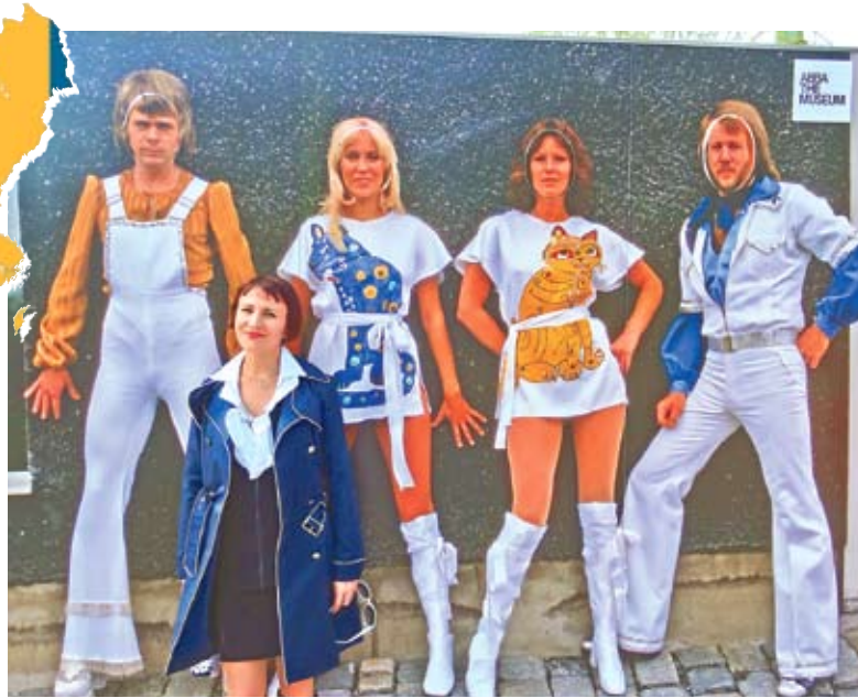
La Muzeul ABBA.

METRO... ÎN METROU: „Metro” este ziarul care m-a ajutat la studierea limbii suedeze și pe care, la fel ca și milioane de suedezi, obișnuiesc să-l răsfoiesc dimineața în drum spre muncă. Este gratuit și poate fi găsit la orice stație de metrou din oraș. Odată citit, ziarul este aruncat în coșuri speciale, de unde urmează apoi să fie colectat și trimis la reciclare.