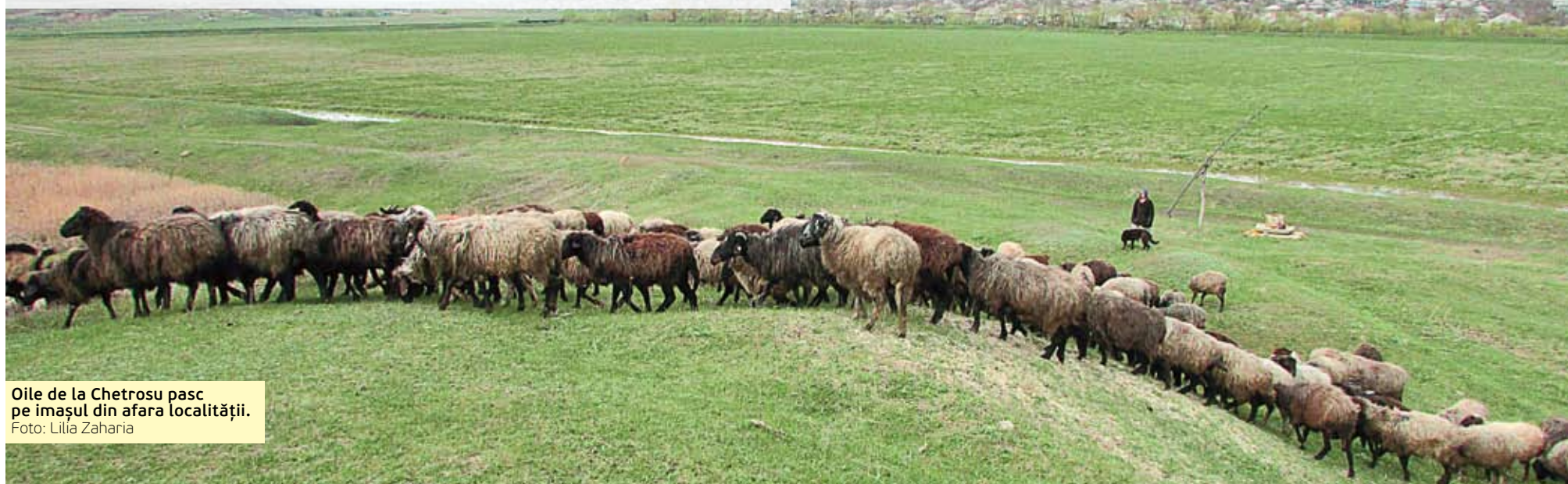
Oile de la Chetrosu pasc pe iamașul din afara localității.