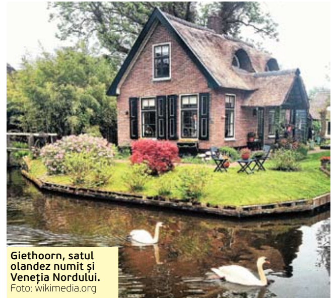
Giethoorn, satul olandez numit și Veneția Nordului.