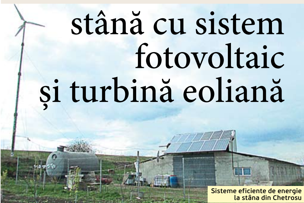
Sisteme eficiente de energie la stâna din Chetrosu

Când mergi spre Chetrosu, la câteva sute de metri până a ajunge în sat vezi, în partea dreaptă a drumului, un deal abrupt. Drumul de țară ce șerpuieste spre vârful dealului ne duce până la o stână. La intrare, ne întâmpină câțiva câini ciobănești care, la vederea necunoscuților, latră furios și responsabil, atenționându-ne că aici ei sunt stăpâni. Pe vârful dealului se înalță o turbină eoliană, morișcă de care mai rar vezi în Moldova. Iar pe încăperea unde oile se adăpostesc pe timp de iarnă sunt instalate panouri solare.