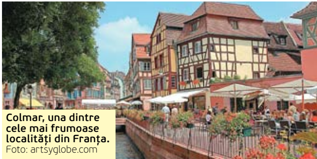
Colmar, una dintre cele mai frumoase localități din Franța.