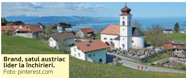
Brand, satul austriac lider la închirieri.