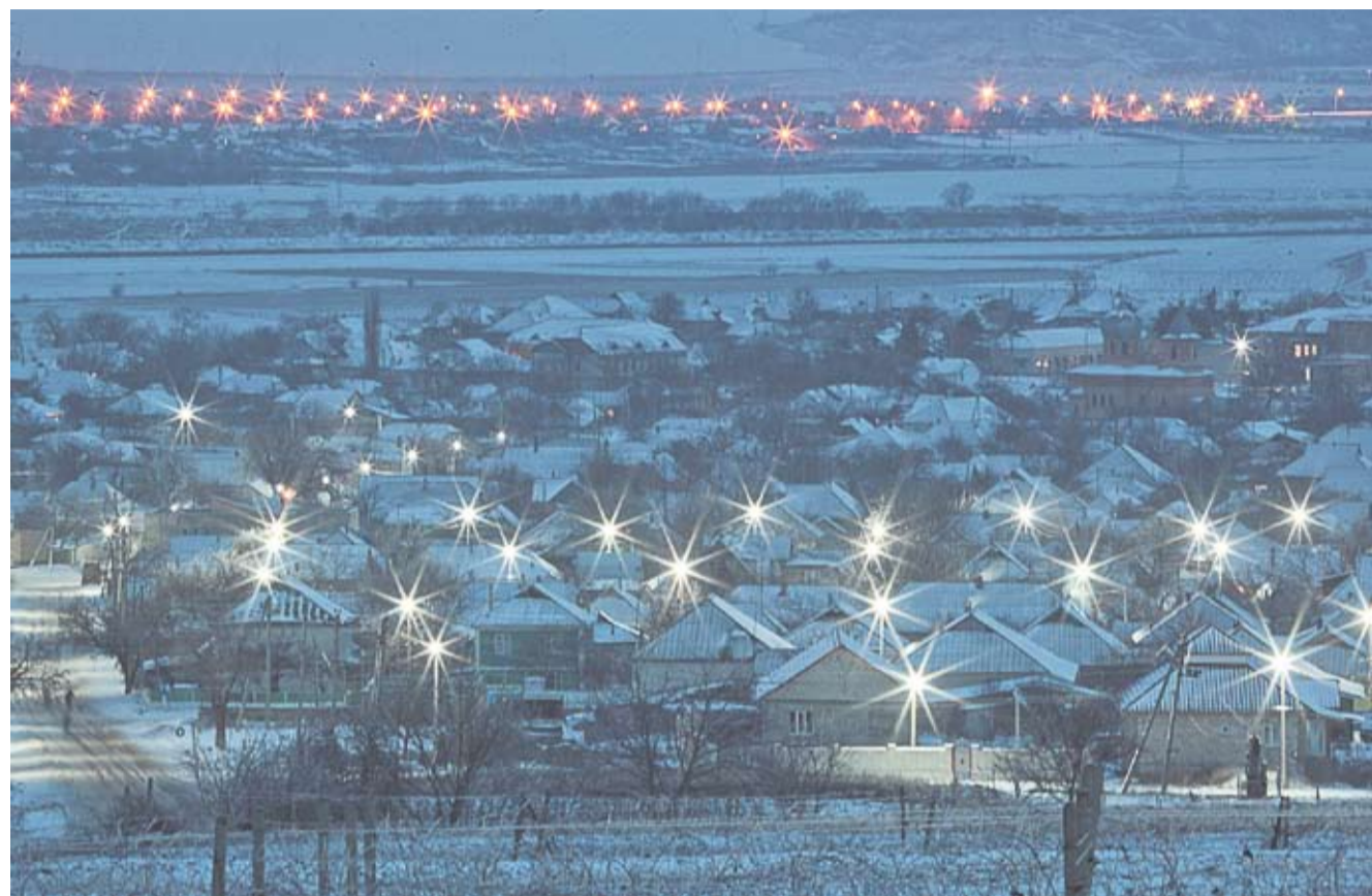
De la începutul acestui an, ambele localități de pe malul Nistrului sunt iluminate. De partea dreaptă e satul Ustia, de cea stângă - orașul Dubăsari.

Acestea, dar și multe alte acțiuni desfășurate pe malul drept și cel stâng al Nistrului au drept scop să contribuie la sporirea gradului de încredere între oamenii de pe ambele maluri ale Nistrului, prin implicarea autorităților locale, organizațiilor societății civile, comunității de afaceri și altor