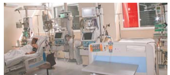
Salonul în care se afla doamna Vieru după intervenția chirurgicală la inimă.