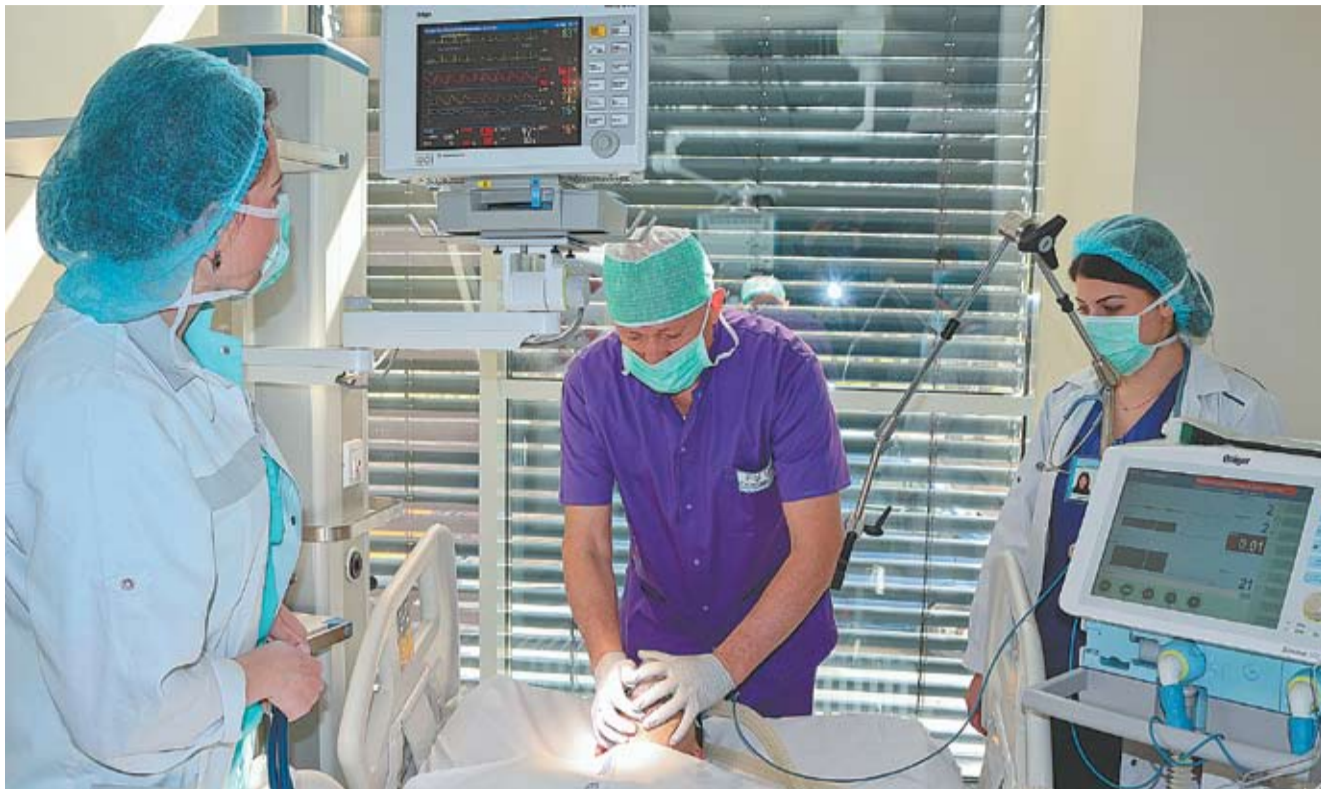
Sala de anestezie a SCR.