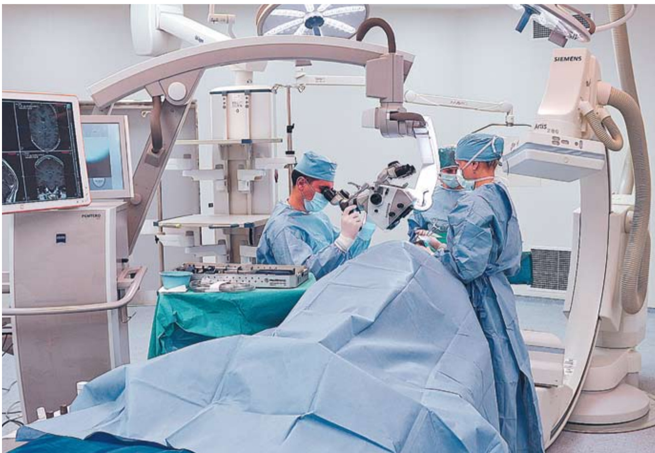
Sala hibrid din cadrul SCR din Chișinău.