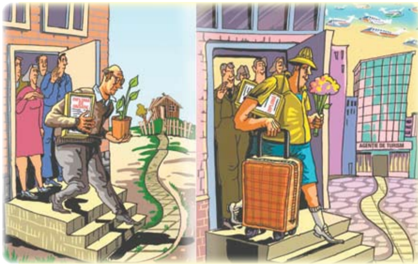
Caricatura: IDIS „Viitorul” și Institute of World Policy (IWP) din Ucraina

În statele membre ale Uniunii Europene, speranța de viață este, în medie, de 77 de ani (bărbați) și 83 de ani (femei). În R. Moldova, acest indicator este de 68,1 ani pentru bărbați și de 75,6 ani pentru femei. În Uniunea Europeană oamenii trăiesc, în medie, cu 10 ani mai mult decât în Ucraina și cu 13 ani mai mult decât în Rusia.