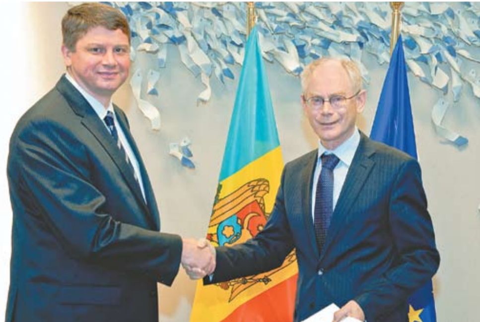
Împreună cu Herman Van Rompuy, Președintele Consiliului European

— Ratificarea Acordului de Asociere are o importanță deosebită în instituționalizarea relațiilor bilaterale moldo-comunitare și la acest capitol se înregistrează o dinamică