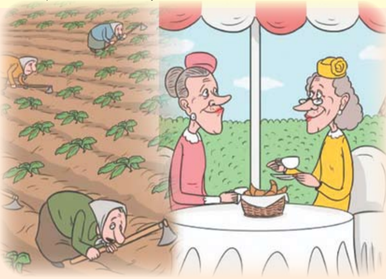
Caricatura: IDIS „Viitorul” și Institute of World Policy (IWP) din Ucraina

Uniunea Europeană se află pe primul loc în lume la acordarea protecției sociale pentru cetățenii săi - 30% din PIB (datele Eurostat). În R. Moldova, acest indicator era de 13,5% în 2011. Această diferență e vizibilă în special la capitolul pensii. În Germania, pensia minimă constituie 350 euro (chiar dacă nu ai lucrat nicio zi și nu ai contribuit la Bugetul Asigurărilor Sociale) - pensia medie - aproximativ 800 euro pe lună. În Franța, pensia minimală este de 500 euro lunar, în Marea Britanie - 760 euro. În R. Moldova, pensia medie lunară era de 50 euro în 2013 (957,6 lei).