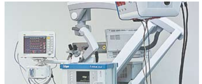
Aparate de diagnosticare a diferitor boli, depistarea lor fiind posibilă chiar dacă maladia este în stare incipientă.