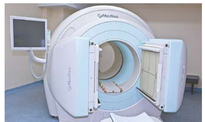
Aparat modern de diagnosticare a bolilor, inclusiv a tumorilor maligne.