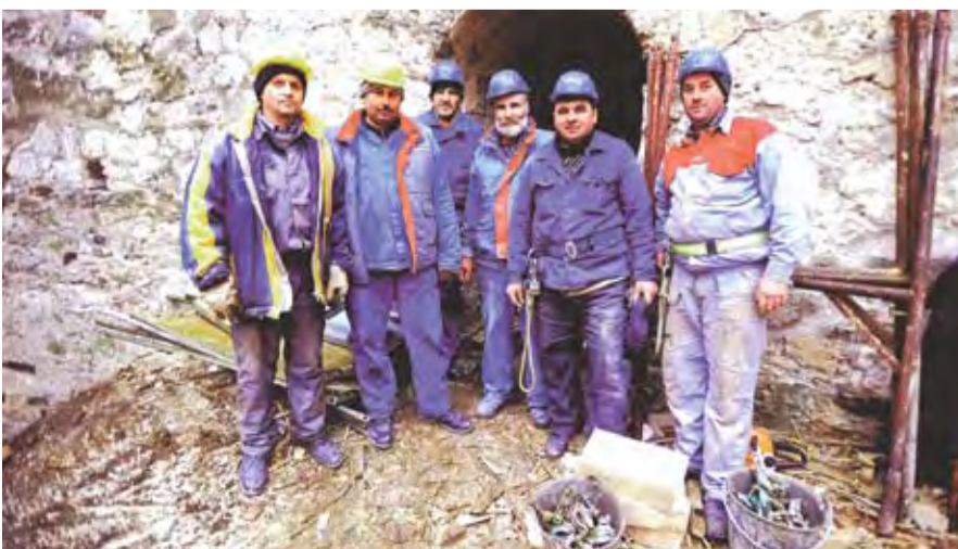
Câțiva din muncitorii care lucrează în prezent la restaurarea Cetății Sorocii

Lilia Zaharia, Asociația Presei Independente