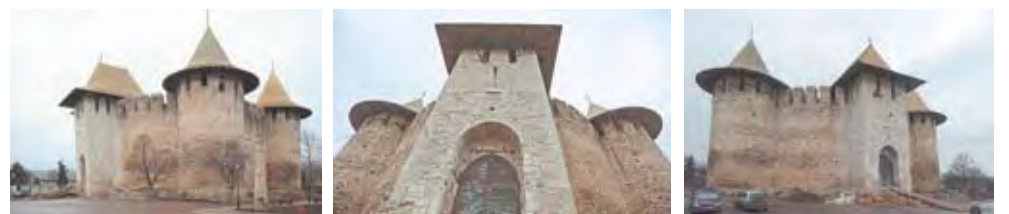
Exteriorul Cetății Soroca.