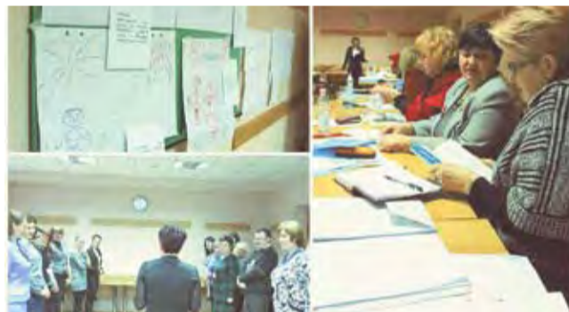
La sesiunea de pregătire a 70 de coordonatori locali

Campania se va încheia în luna mai, când școlile participante vor desfășura o serie de „Târguri ale Uniunii Europene”. Până atunci, în cadrul „Săptămânii Uniunii Europene” care vor fi organizate în perioada 9-27 martie, în cele peste 1200 de instituții de învățământ