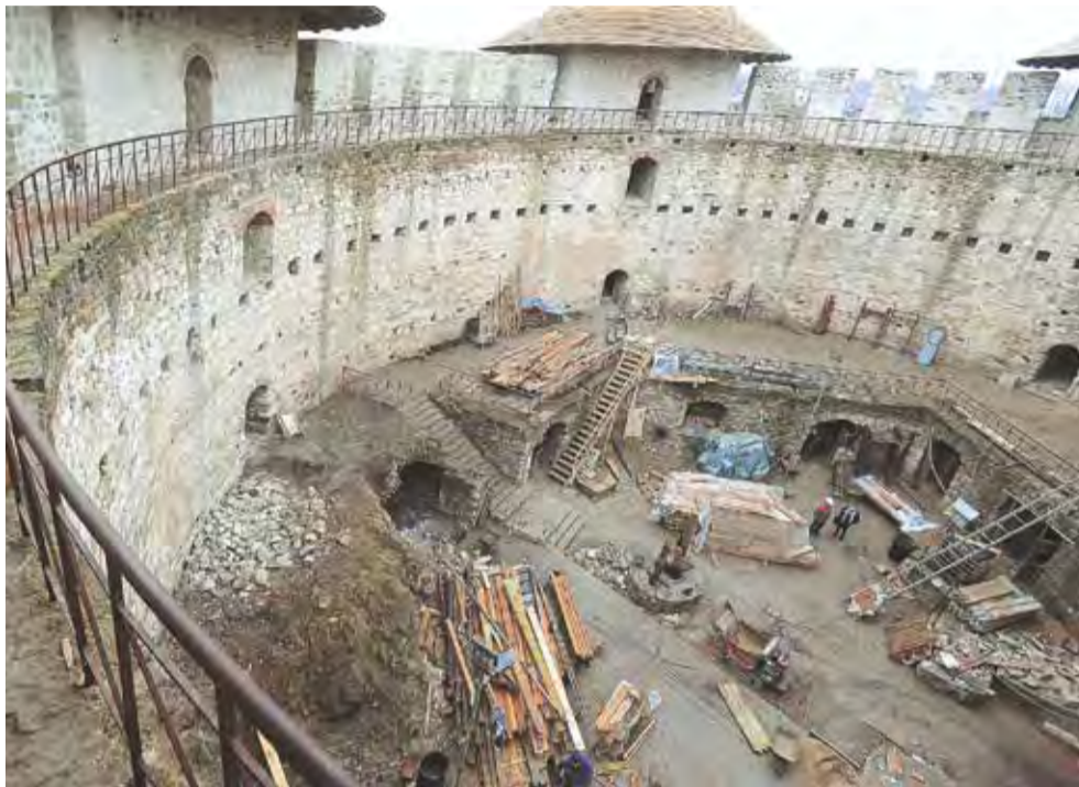
Lucrările de renovare în interiorul cetății.