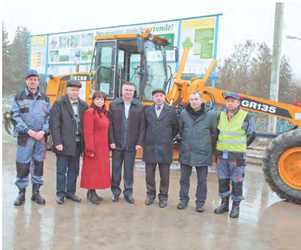
(A. Ș.) Evenimentul de lansare a ICI Ciuciuleni

ICI Ciuciuleni este una dintre cele zece întreprinderi de cooperare intercomunitară, care au reunit 40 de primării. Serviciile publice prestate de ICI sunt colectarea și evacuarea deșeurilor, iluminarea strădală, întreținerea și dezapezirea drumurilor ș.a., fiind o alternativă viabilă, mai ales, pentru primăriile mici, cu mai puțin de 5000 de locuitori. Valoarea totală a granturilor oferite pentru proiecte este de un milion USD. Proiectul este implementat cu sprijinul Programului Comun de Dezvoltare Locală Integrată (PNUD Moldova și UN Women) și cu susținerea Guvernului Danemarcei.