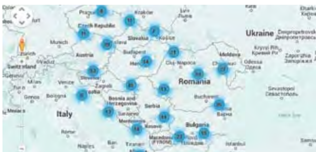
Școlile care au participat la proiectele Academiei

Academia Școlilor din Europa Centrală a lansat un nou concurs de proiecte dezvoltate în parteneriate internaționale între școli, iar tema din acest an este „Solidaritate”. Școlile din Republica Moldova sunt așteptate să depună proiecte care să țină de tematica solidarității, sub sloganul „Suntem solidari: ne pasă, îndrăznim, ne implicăm”. Pentru aceasta, între 15 ianuarie - 15 aprilie 2015, școlile din Moldova trebuie să găsească parteneri internaționali, împreună cu care să prezinte o propunere comună de proiect. Apoi se adresează instituțiilor, a căror grupuri-țintă de elevi