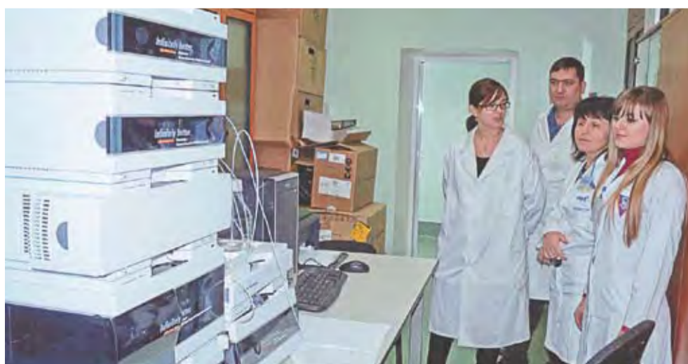
În vizită la Centrul Republican de Diagnostic Veterinar.

— Starea de fapt, de la care au pornit spre Uniunea Europeană mai multe dintre actuale țări membre - în special, cele care au aderat după anul 2004 - este în mare măsură similară cu situația de azi din Moldova. Este vorba de ponderea agriculturii în economia națională, de modelele agricole și de relațiile comerciale care existau în perioada de pre-aderare. Eu am participat la toate etapele pe care le-a parcurs, în domeniul agro-alimentar, România pentru a adera la UE - transpunerea legislației comunitare în legislația națională, constituirea agenției responsabile de siguranța alimentelor, instruirea personalului și a operatorilor din sector, modernizarea și restructurarea unităților de producere a alimentelor, aprobarea pentru export. Nu a fost deloc ușor, dar sunt convins că este o cale care - cu efort intern și cu susținere externă, dar mai ales cu multă voință - îi stă în puteri și Republicii Moldova.